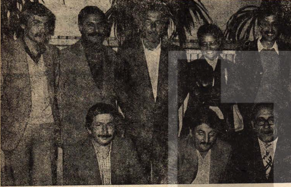
D.İ.E. Matbaasında emekli olan üyelerimiz törenle uğurlandı

«Emekli olan diğer arkadaşlarım adına hepimize teşekkür ederim. Hayatımızın yeni bir dönüm noktasında DİSK BASIN - İŞ'e üye olmak, bizim için en kıvanç verici bir olaydır. Sınıfımızın hak ve varlığını koruma yolunda büyük çaba gösteren örgütümüze, burada bıraktığımız arkadaşlarımızın sonuna kadar sahip çıkacaklarına, hiçbir baskıya boyun eğmeden bunu sürdüreceklerine inanıyorum.»